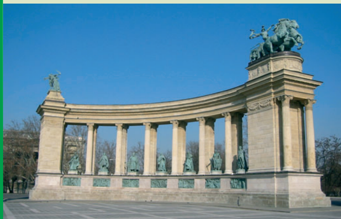
Budapest, Piazza degli Eroi

È la chiesa più grande della città con una capienza di 8.500 posti e una cupola alta 96 metri. I tempi della sua costruzione furono talmente lunghi che a Budapest si usava dire ai debitori: «ti restituirò i soldi quando sarà terminata la Basilica».