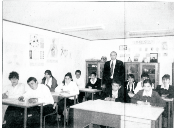
di Enrico Giardini

Commuove sapere che al giovane direttore della scuola di Krasar vengono gli occhi lucidi quando vede un giornalista veneto proprio là, davanti alla scuola, negli stessi panni da aver frequentato subito dopo il terremoto che gli ha portato via amici e parenti. E commuove sapere che il tuo giovane collega si sbarazzò centinaia di chilometri di buche per andare a vedere se quella scuola era davvero ancora là, era davvero ancora frequentata da centinaia di ragazzi. Perché la Scuola Verona è il simbolo tangibile di una solidarietà che non ha confini, di un cuore che attraverso L'Arena aveva pulsato in precedenza anche per lasciare un segno nella Longarone travolta dall'ondata di fango, a Montenas e in Friuli, e nel terremoto e nell'Etiopia flagellata dalla carestia.