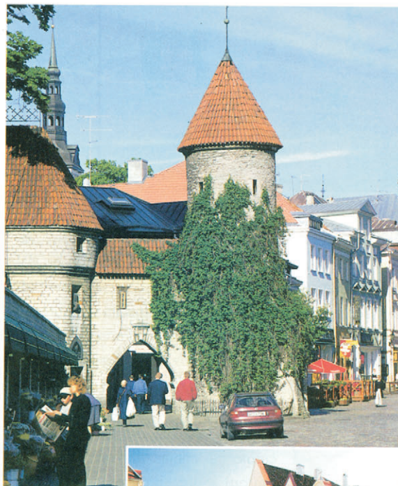
L'ingresso nella città vecchia, attraverso Porta Piru. In basso, via Vene con il cancello della chiesa di Pietro e Paolo e la chiesa di San Nicola dei miracoli

Un quartiere, occorre dire, sempre più affollato di villette residenziali, costruite in larga misura in mezzo a dei salubri boschi di pini, e abitati dalla nuova élite del Paese, avvocati, banchieri, gente d'affari, costruttori, proprietari di night club o di alberghi o di ristoranti, ingegneri e specialisti dell'alta tecnologia, quella che incanta un Paese che al suo ingresso in Europa non vuole presentarsi col cappello in mano. Questo perché c'è ancora da dire che l'Estonia è forse il Paese dell'Europa dell'Est che uscita (nel 1991) dagli anni della stagnazione sovietica, presenta un ritmo di sviluppo fra i più elevati; è probabilmente il Paese che si è spinto più avanti nella strada di un ultraliberalismo. Dove, come dicono, "ogni scommessa è vincente". Dove può capitare che un giovane intraprendente cominci con l'importare abiti di foggia occidentale, venda automobili, diventi proprietario di cinema.