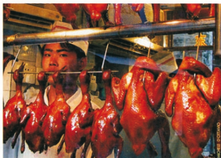
Una fase della lunga preparazione necessaria per gustare un'ottima anatra laccata. In alto, zuppa di trippe servita in tronchetti di bambù. Nella pagina di destra, un chiosco di street food

« B uchi la jiao jiu bu shi ge ming zhe . Ovvero: «Chi non mangia piccante è un nemico della rivoluzione». Questa perentoria affermazione di Mao Zedong lascia intuire quanto i profondi cambiamenti introdotti nella società cinese all'alba degli anni 50 abbiano interessato anche il mondo della cultura gastronomica. Pechino da sempre accoglieva tra le mura della Città Proibita i migliori cuochi dell'area. Costoro diedero vita a un ricchissimo e variegato repertorio di piatti che ancora oggi caratterizzano l'alta cucina pechinese nota come "cucina dell'era imperiale". Le cronache dell'epoca narrano, infatti, di sontuosi banchetti organizzati a palazzo sotto le diverse dinastie, vere e proprie maratone culinarie che vedevano sfilare per tre interi giorni - dall'alba al tramonto - i 365 piatti che componevano il menu delle feste di corte.