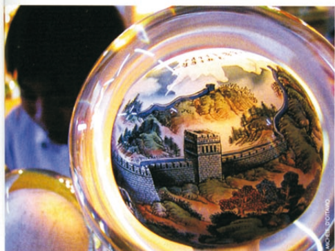
Un tratto della Grande Muraglia dipinto su un souvenir

Undici giorni possono bastare per scoprire quattro must cinesi nel tour chiamato "Prisma di Giada", che si snoda da Shanghai (cui TuttoTurismo dedicherà un articolo nel numero di settembre) a Pechino, con tappe a Guilin (visita della città ed escursione in battello sul fiume Li, con pranzo a bordo) e a Xi'an (visita della città ed escursione alla tomba imperiale presso cui è stato ritrovato l'esercito di terracotta). Con vo-