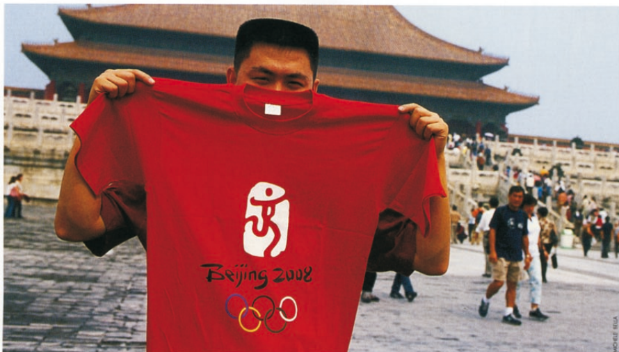
Una maglietta decorata con l'omino-ideogramma adottato come logo delle Olimpiadi. Nella pagina di destra, il Tempio del Cielo