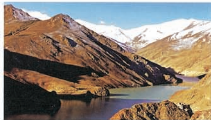
Le gole dello Yangtze

Dopo un 2008 in cui si è fermato tutto per vari motivi, «nel 2009, crisi economica e andamento dei cambi permettendo, crediamo in una ripresa che ci riporti ai numeri del 2007». Oggi la Cina, dal punto di vista delle