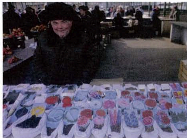
Un anziano moscovita al mercato con la sua mercanzia; nel suo viso una tranquilla serenità; nella foto a sinistra, uno scorcio dei famosi magazzini Gum, ora non più meta di soli stranieri o di ricchi locali. Prodotti a prezzi contenuti e accessibili anche ai pensionati.

La rivoluzione politica e sociale avvenuta dopo la caduta dell'Unione Sovietica ha avuto contraccolpi anche sulle persone anziane. Ma ci sono città, come San Pietroburgo, dove le amministrazioni locali hanno reso possibile a questa fascia della popolazione un approccio «morbido» con la nuova realtà. In grande sviluppo anche il turismo. «La rinascita» della religione a lungo repressa.