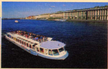
San Pietroburgo (Russia). Un battello porta i turisti tra i 65 fiumi e canali della città. A lato, il museo dell'Ermitage nel Palazzo d'Inverno.

zionalità prussiana Johann Analog. Inoltre vi sono vari servitori, per un totale di 27 persone, di cui 15 maschi e 12 femmine. Ci sembra proprio di vederla, questa casa grande, benestante e plurinazionale.