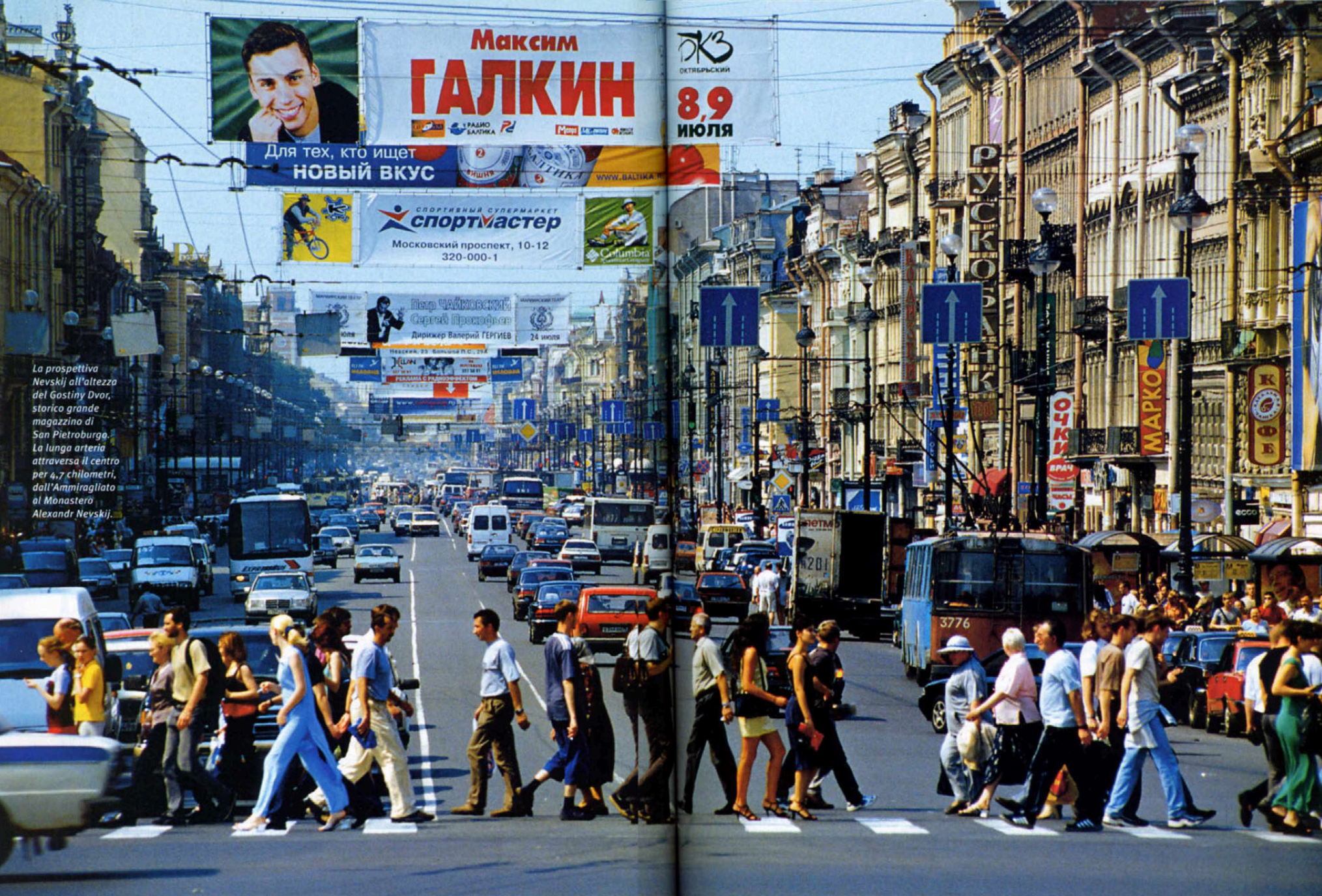
La prospettiva Nevskij all'altezza del Gostiny Dvor, storico grande magazzino di San Pietroburgo. La lunga arteria attraversa il centro per 4,7 chilometri, dall'Ammiragliato al Monastero Alexandr Nevskij.