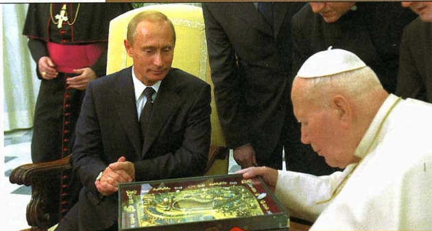
Sopra: Giovanni Paolo II mostra l'icona della Madonna di Kazan' al presidente russo Putin durante l'udienza del 5 novembre 2003. Sotto: una copia della stessa icona.

STORIA DELL'ICONA CHE IL PAPA RESTITUIRÀ ALLA CHIESA ORTODOSSA