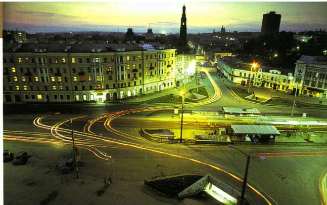
Sopra: un'immagine notturna del centro di Kazan'. Sotto: Vladimir Putin (a sinistra) insieme con Mintimir Shaimiev, presidente della Repubblica autonoma del Tatarstan.

Come si diceva, però, il Tatarstan e Ka-