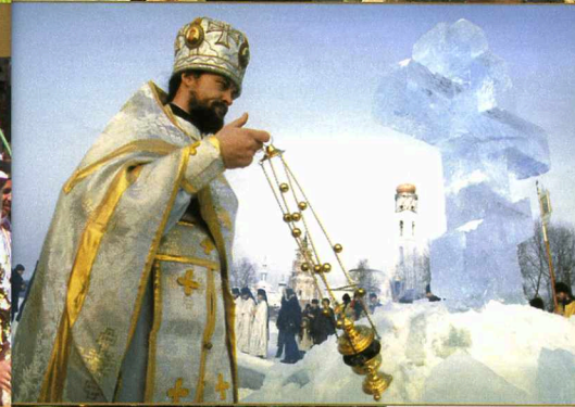
Sopra e qui accanto: due immagini della solenne cerimonia che ogni inverno si svolge al monastero della Madre di Dio, presso Kazan'. Sotto: operai dello stabilimento di Elabuga, dove vengono assemblate Chevrolet Blazer, e contadini tatarati in un villaggio.