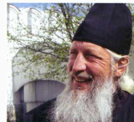
L'icona (una copia dell'originale) della Madonna di Kazan nella basilica di San Pietro e Paolo. A destra, un monaco del monastero di Raif.