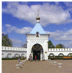
Una cappella del monastero della Vergine di Raif, meta di pellegrini di tutta la Russia.

La religiosità ortodossa nel Tatarstan ha nel monastero della Vergine di Raif, a una quarantina di chilometri da Kazan, un'espressione di vita spirituale, artistica e sociale di alto valore. Fondato nel 1613 dal monaco Filarete, distrutto in vari incendi e più volte ricostruito (l'attuale è frutto gran parte del lavoro degli ultimi 10 anni), conserva una copia del 1700 dell'icona della Madonna della Georgia, che si trova nel monastero di Sant'Arcangelo sul Mar Bianco. Cinquanta tra preti e novizi e un orfanotrofio che accoglie 22 bambini in un ambiente da far invidia a strutture occidentali e un sito Internet ( www.raifa.ru ).