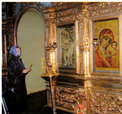
Devozione La copia dell'icona della Madonna di Kazan custodita nella Cattedrale dei Santi Pietro e Paolo, nel cuore della Capitale