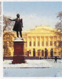
3- Il Museo Russo. Del progetto originale di Carlo Rossi, terminato nel 1825, rimangono soltanto lo Scalone d'onore e il Salotto bianco.

all'arte dell'800, con i capolavori di Ilya Repin. All'inizio del '900 fu aggiunta l'ala Benois, che ospita le opere degli artisti dell'Avanguardia russa (Tatlin, Gončarova, Chagall, Malevič), del "Mondo dell'arte" e della "Rosa azzurra".