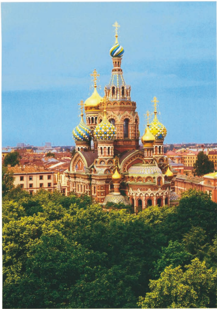
Qui sopra: cinta dal verde del giardino Michajlovski, la chiesa della Resurrezione è una sinfonia di ori, smalti, mosaici e piastrelle smaltate.