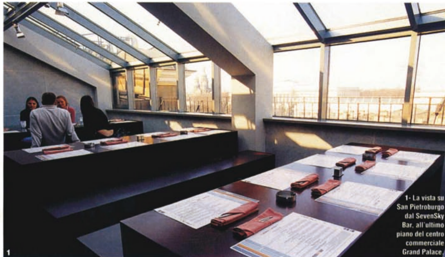
1- La vista su San Pietroburgo dal SevenSky Bar, all'ultimo piano del centro commerciale Grand Palace.