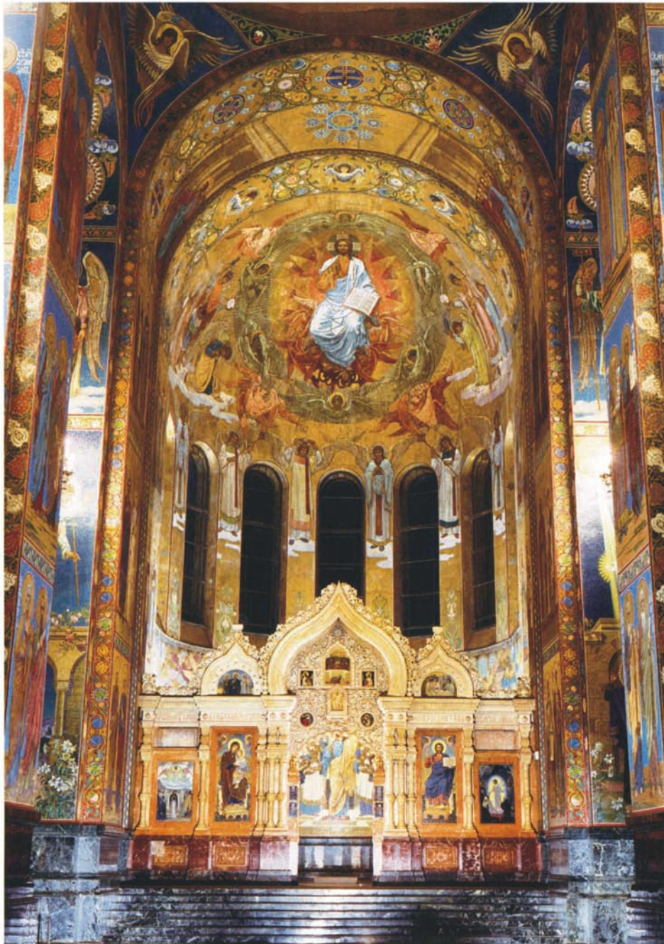
Qui sopra: nella navata centrale, il catino absidale con il mosaico del Cristo in gloria su disegno di N. Charlamov, e l'iconostasi in pietra.