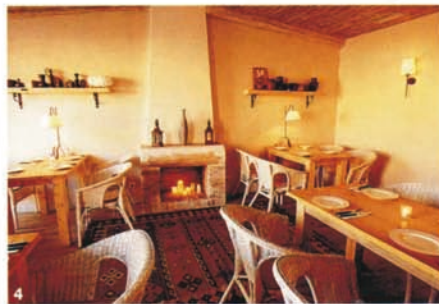
4- Il ristorante Aragvi: le ceramiche scure contribuiscono a creare una calda atmosfera georgiana. 5- Il lussuoso Dvorjanskoe Gnezdo, Nido di Nobili.