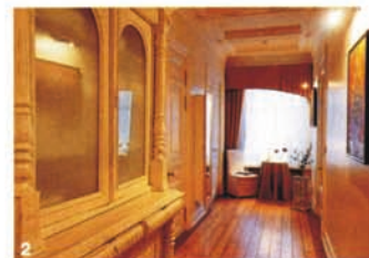
2- Un corridoio del piccolo ed esclusivo hotel Casa Leto, nel cuore della città: le stanze sono arredate con mobili di legno bianco.

dispone di 5 stanze, che portano i nomi dei grandi architetti italiani e ticinesi (Rossi, Quarenghi, Rastrelli, Rinaldi e Trezzini) e sono arredate con opere d'arte contemporanea, mobili antichi e ogni comfort. Le tariffe (da 170 a 235 euro per stanza) sono all inclusive : oltre alla colazione comprendono rinfreschi, telefonate locali, Internet e bibite.