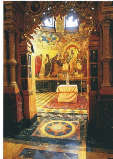
Qui sopra e a sinistra: il Sacramento dell'Eucarestia, raffigurato sulla parete dell'altare. Il grande mosaico misura 168,3 metri quadrati, anch'esso realizzato su disegno di Nikolaj Charlamov. Unica in Russia a essere interamente decorata all'interno da mosaici, la chiesa della Resurrezione vanta 7mila metri quadrati di tessere, su disegni e cartoni dei più affermati artisti sovietici.

cupole fantasiose avvicinano i due monumenti, diversa è infatti la struttura architettonica, la cosiddetta forma "a nave" della basilica pietroburghese, cruciforme, con cinque cupole smaltate e un campanile. L'architetto considerava la vera novità del suo progetto i grandi timpani a kakosnitil (simili a diademi tradizionali) e decorati a mosaico delle facciate settentrionale e meridionale, ma in complesso la chiesa della Resurrezione, portata a termine nel 1907, quando lo stile moderno aveva raggiunto il suo apice mettendo in ombra quello storicistico, può essere considerata un'antologia dell'architettura russa del XVII secolo.