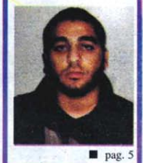
■ pag. 5