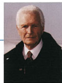
La Turchia risponde all'esigenza di tour non troppo lunghi, ma vari

Non è un caso che siano in crescita anche le combinate Turchia/Bulgaria, Turchia/Siria o Turchia/Uzbekistan, mettendo in evidenza i legami storici e culturali con il bacino circostante, le potenzialità di sviluppo economico, l'importanza nella stabilizzazione delle regioni al confine fra Europa e Asia. Un tassello geopolitico che appare dunque imprescindibile per comprendere quali siano le direttrici future del turismo.