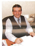
L'Italia si conferma un mercato di grande interesse per la compagnia e con l'orario estivo 2009 abbiamo aumentato le frequenze